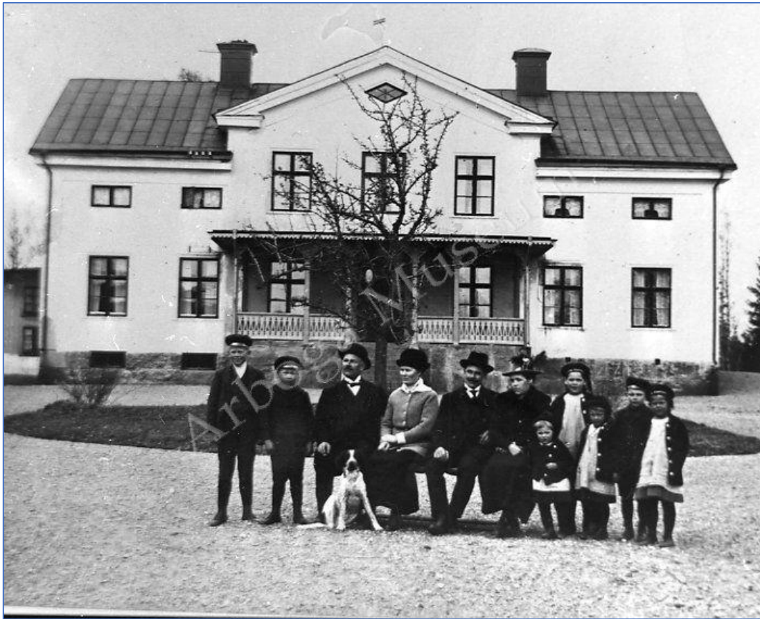
Vibyholm Mangårdsbyggnad år 1919.