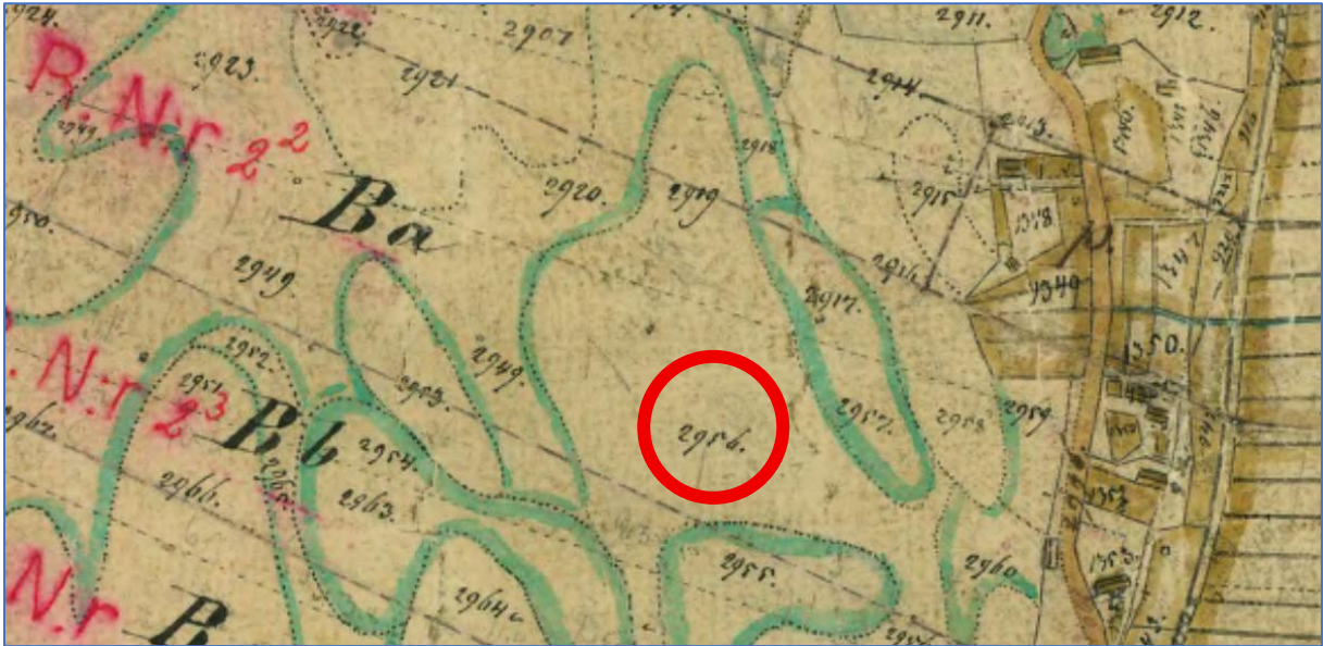
Del av skifteskartan med området 2956 som exempel (området för mangårdsbyggnaden Vibyholm)