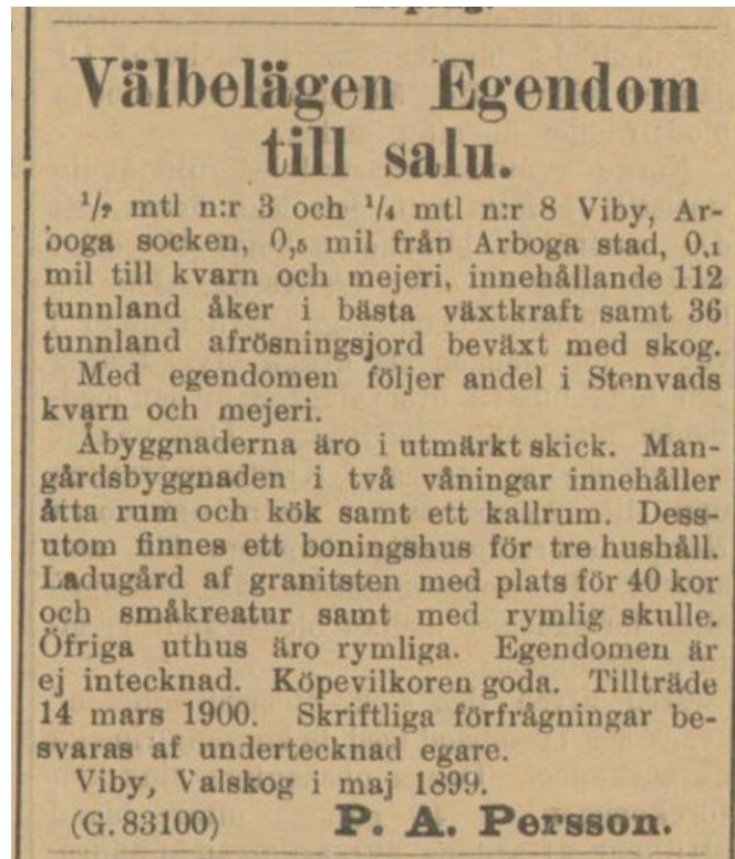
Figur 2 Köpings-Posten 17 juni 1899