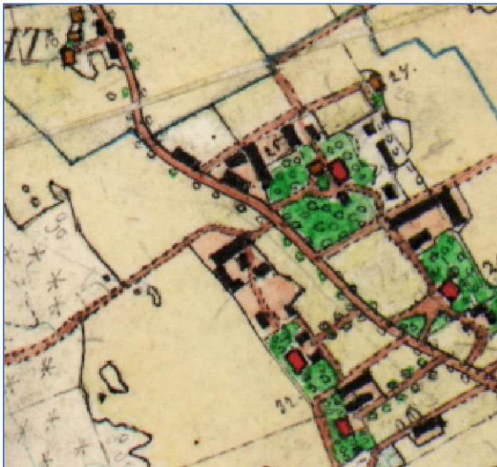
Figur 8 Del av Häradsekonomisk karta 1905 - 1911, ref Lantmäteriet Valskog J112-73-14

Nästa tillgängliga karta är den häradsekonomiska kartan från 1905 – 1911