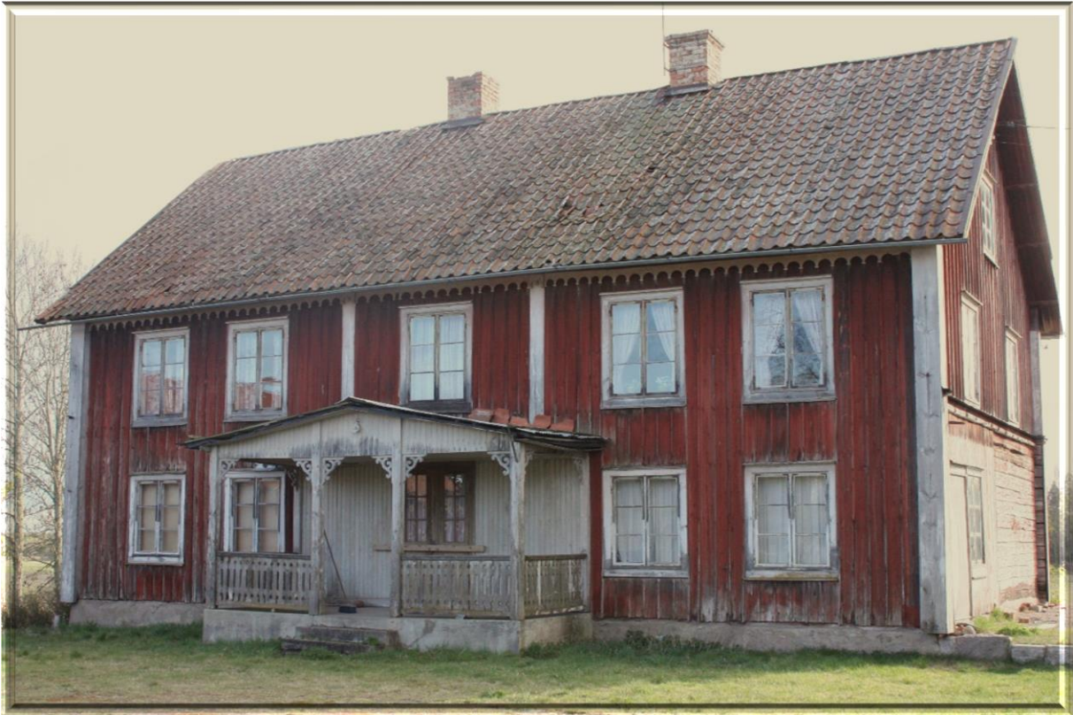
Figur 1 Foto våren 2020. Lars Karlsson

Fastigheten är till salu under våren 2020 och har varit utannonserad på Ludvig & Co fastighetsbyrå med utgångspris av 3,7 miljoner.