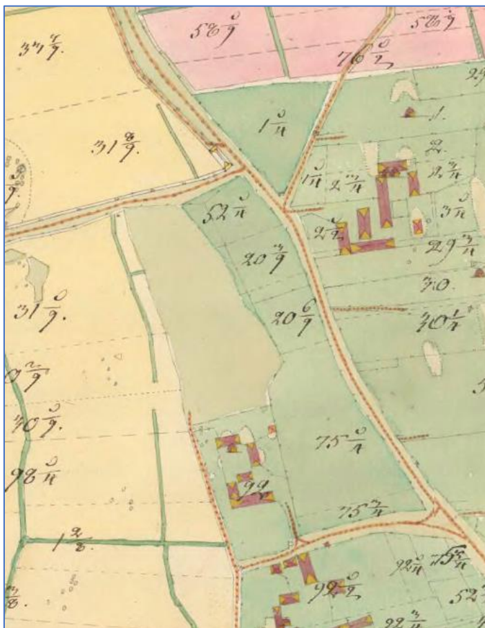
Figur 6 Del ur karta tillhörande Viby Storskifte på Viby 1801 som fastställdes vid Åkerbo Härad's Laga Sommaring den 7 och 17 juni 1802, ref Lantmäteriet Arboga K44

Av kartan från storskiftet 1801 framgår hur byggnationen såg ut då.